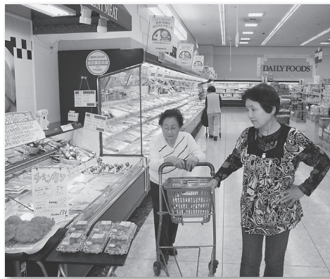
生鮮食品を品定め

「次はいつ あるの」と とても好評 だった買い 物ツアーで した。 「自分で見て買えるのはとて も楽しい」また、連れて行って いただきました。 お願している買い物です。ご 自分でゆっくりとどんなものが 売っているのかを見て回られて いました。