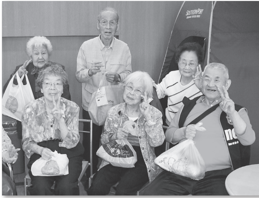
お目当ての物を買えて、にっこり

5月12日(月)～16日(金)に ディアーズコープ たつたがわ などに買い物へ行きました。 この「買い物ツアー」は、利 用者の方の日常生活を充実させ る目的でおこなっています。 普段ご自分では買い物へ行け ず、家族の方や訪問ヘルパーに