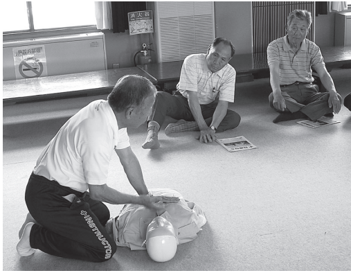
講師の話を熱心に聴きました

参加者は「今回の講習では、講師の方に手順を聞いて、動きましたが、いざ自分ひとりの時にAEDを使う場面が出てきた