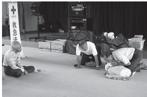
人工呼吸を体験し、習得しました

ときにはどうしようかと思ってしまう。でも今日のこと、少しでも頭にあれば、慌てなくて大丈夫だと思います」との声が聞かれました。