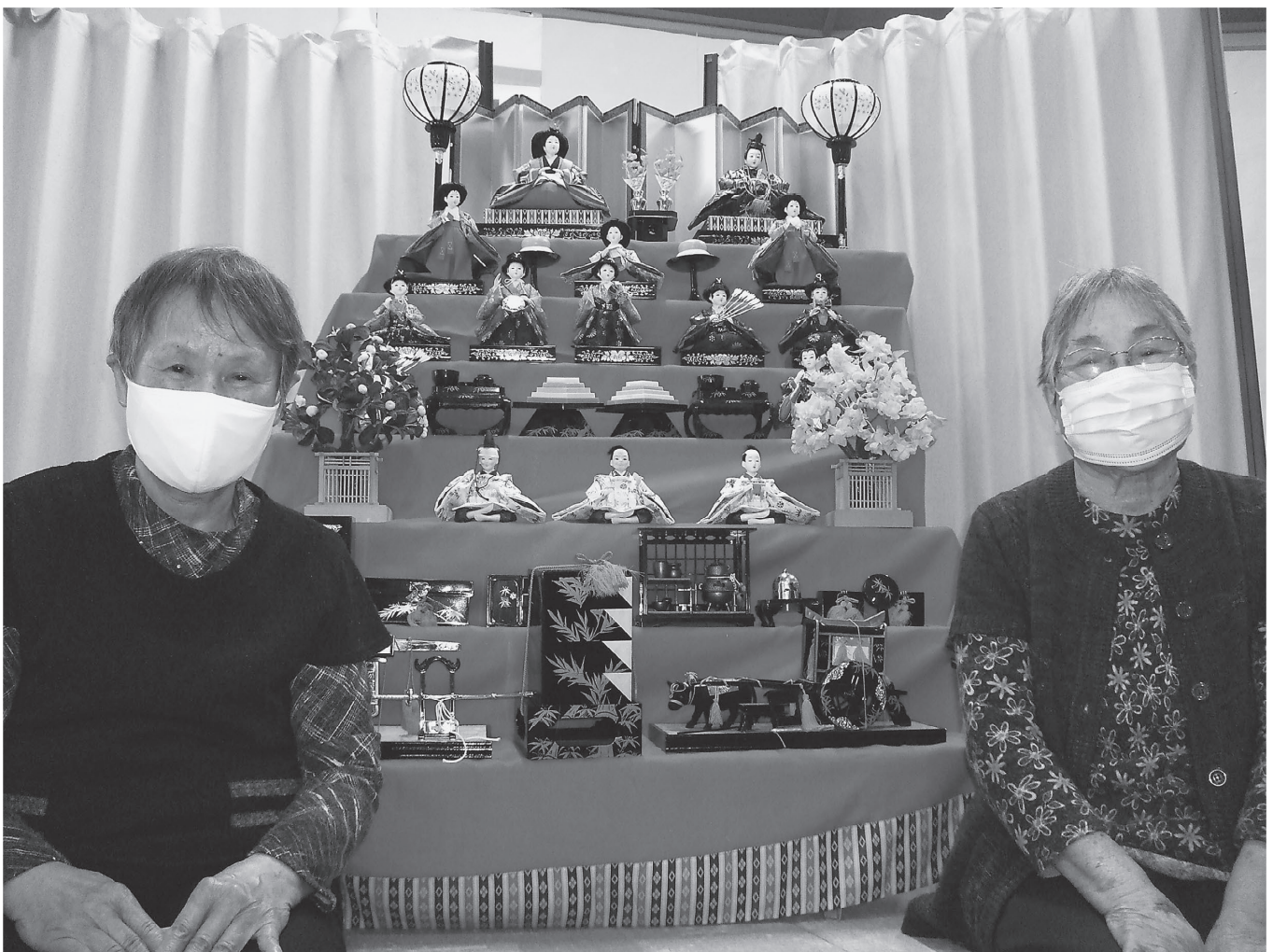
(デイサービスでひな祭り)