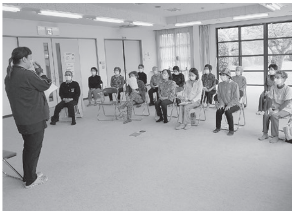
4月22日に開催した“快活ルーム”のようす